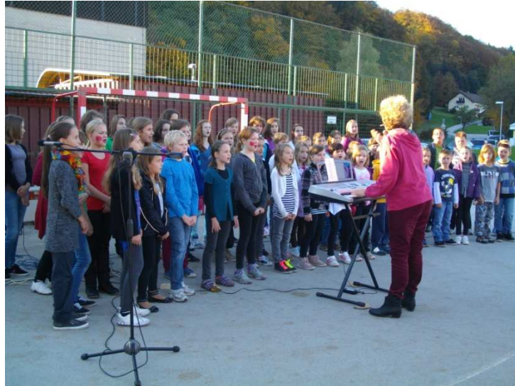
Fotografije: 1-18; Na zabavo v naravo