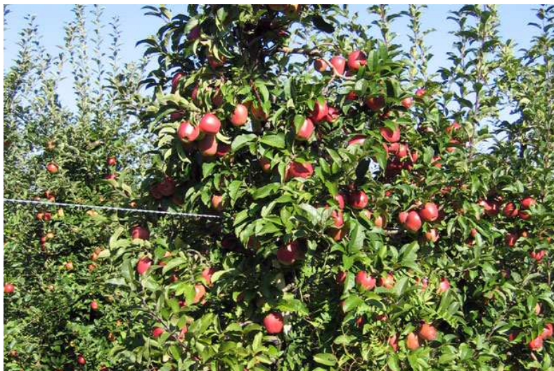
Slika 2: Jablana – vrsta Jonagold