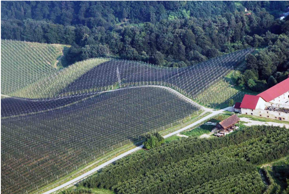
Slika 1: Sadovnjaki nad Brestanico

Držali so se načela 'naredi sam, kar potrebuješ za svoje življenje'. Ukvarjali so se z različnimi vejami gospodarstva: s poljedelstvom, živinorejo, sirarstvom, vinogradništvom, sadjarstvom, (še danes so na istem mestu sadovnjaki, ki pa so se še razširili), čebelarstvom, imeli so nasade zdravilnih rastlin in vse vrste obrtnih delavnic. Naredili so vse, kar se je dalo narediti z rokami.