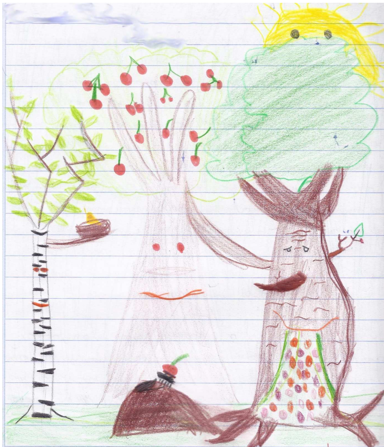
Eneja Perc, 3. a