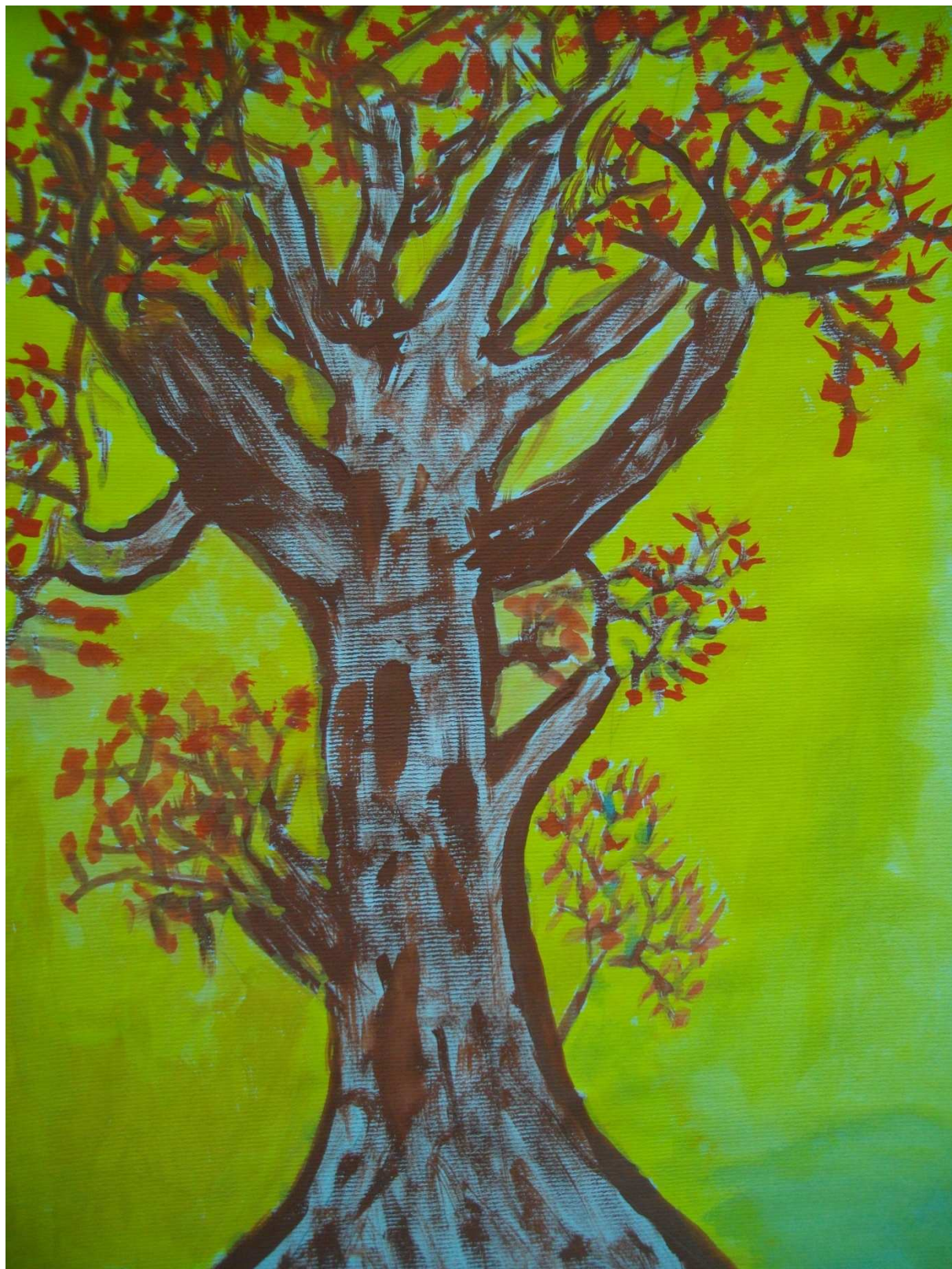
Žiga Cvar, 6. a