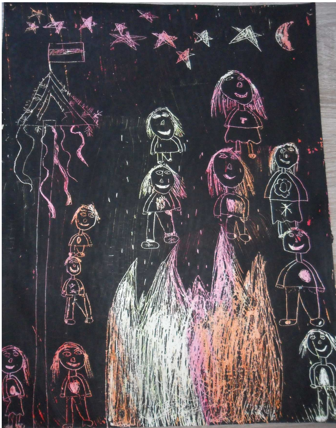
Tinkara Umek, 1. a