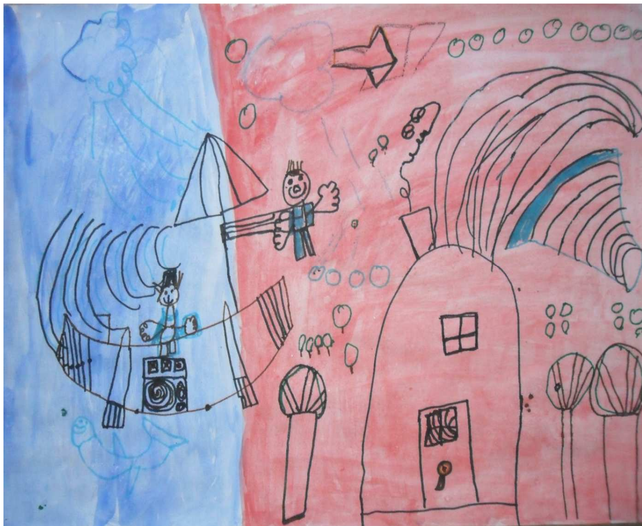
Nejc Kožuh, 1. a