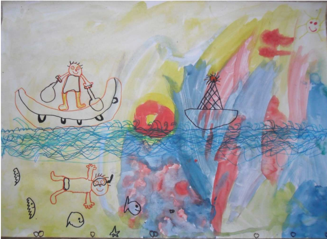
Klemen Bohorč, 1. a