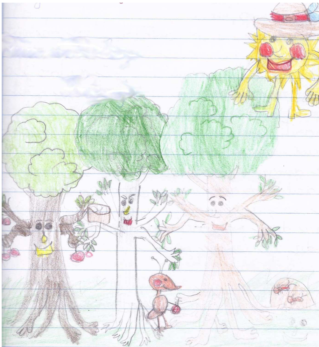
Ana Sluga, 3. a