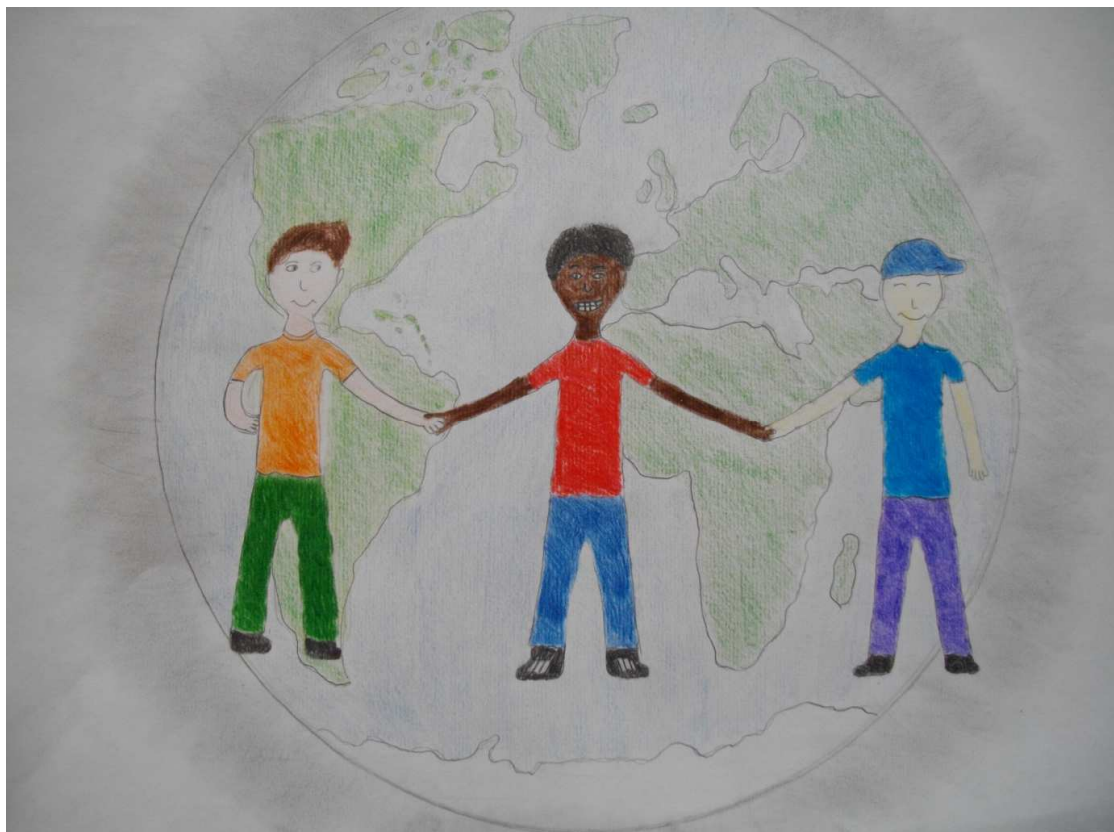
Jure Krajnc, 7. a