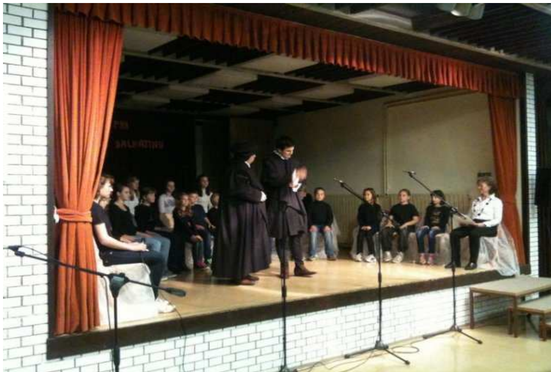
SLOVENSKI TRADICIONALNI ZAJTRK MALO DRUGAČE