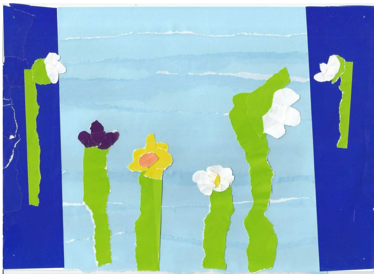
Tinkara Umek, 1. a