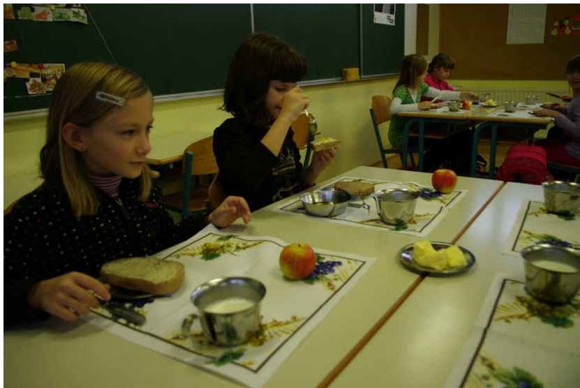
TEHNIŠKI DAN V TOREK, 26. NOVEMBRA 2013