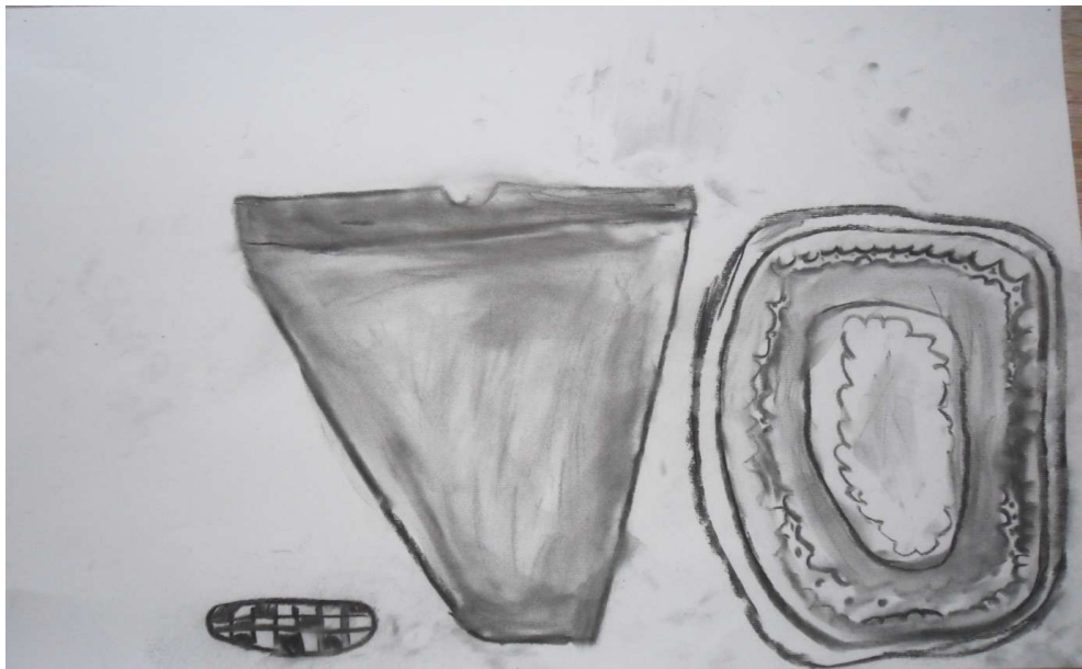
Lea Lebar, 1. a