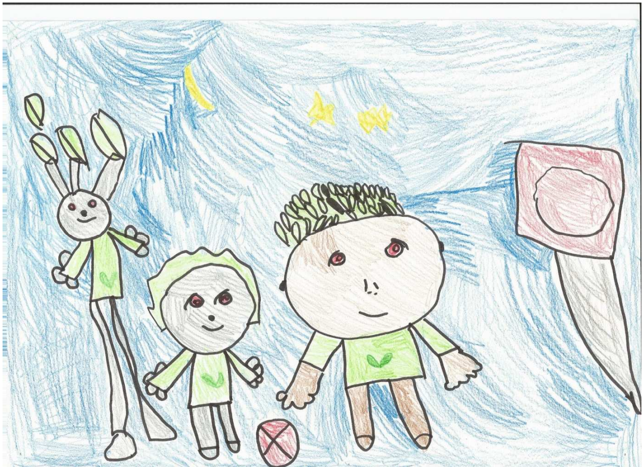
Neja Pirc, 1. a